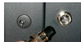
Contacto seco domótico