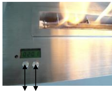
Apertura depósito 2 1 Botón on / off